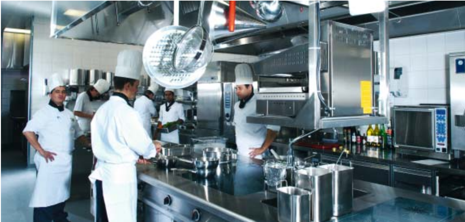
Im Zürich Marriott Hotel wird mit Induktion, aber auch mit Gas gekocht.