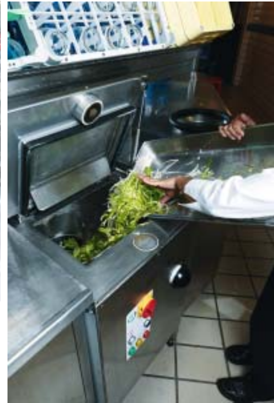
Im modernen Biotank kann man alle Speisen mit einigen Ausnahmen entsorgen.

Haari Food Systems empfiehlt, bei der effizienten Kundenlösung nach einem Fragekatalog vorzugehen. Welches Kundensegment will man ansprechen? Mit welchem Speiseangebot, in welcher Ausgabeart und auf welchem Preisniveau kann man mit dem definierten Kundensegment die notwendige Wertschöpfung erreichen? Nach diesen wichtigen Infos wird eine Küche modular geplant und kostengünstig angeboten.