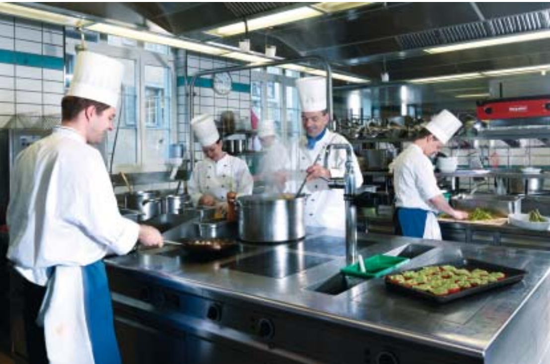
Die Küche des städtischen Hotel Storchen in Zürich ist funktionell und auf das direkte Einkaufen-Verkaufen eingerichtet.